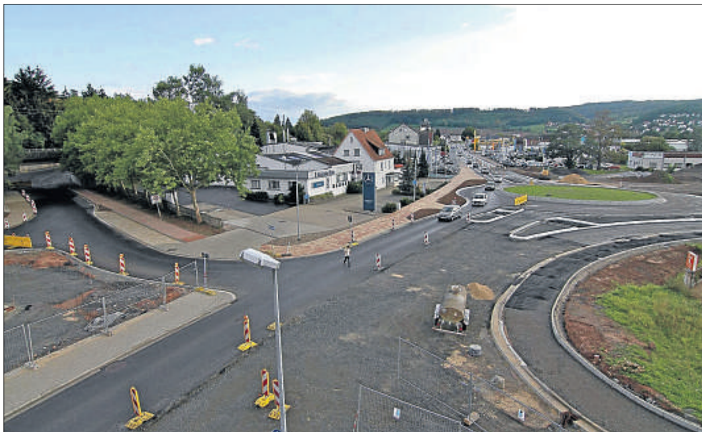
Letzte Arbeiten am Löwe-Kreisel: In den nächsten Tagen werden die Fahrbahnen asphaltiert. Ab 19. September sind die Umleitungen aufgehoben.

Mehr Wissenswertes aus der Heimat im RegioWiki: http://zu.hna.de/nG1qfD